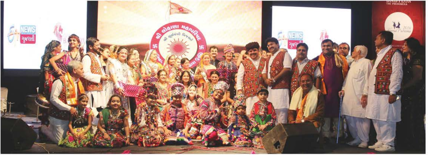
શ્રી લોહાણા મહાપરિષદ આયોજિત નવરાત્રી મહોત્સવમાં ખૂબ જ ઉત્સાહભરે પ્રદર્શન કરી વિજેતા બનેલા ખેડેયા સ્પર્ધકો.