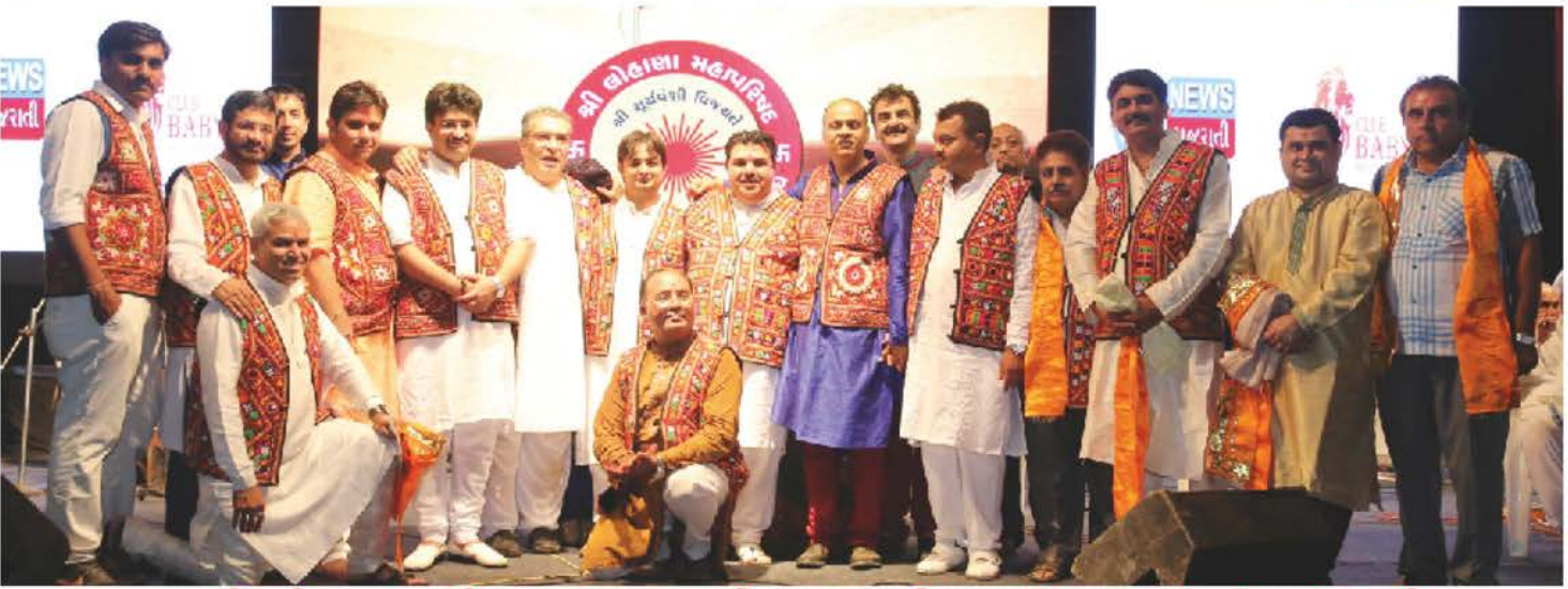
નવરાત્રી મહોત્સવ-૨૦૧૬ને સફળ બનાવવા માટે ફક્ત ત્રણ દિવસના ટૂંકા ગાળામાં સુંદર સંકલનથી માતૃસંસ્થા પ્રત્યેના પ્રેમનું દર્શન કરાવતા કચ્છી કોટીમાં સજ્જ યુવાન મિત્રો... વડીલો સાથે.